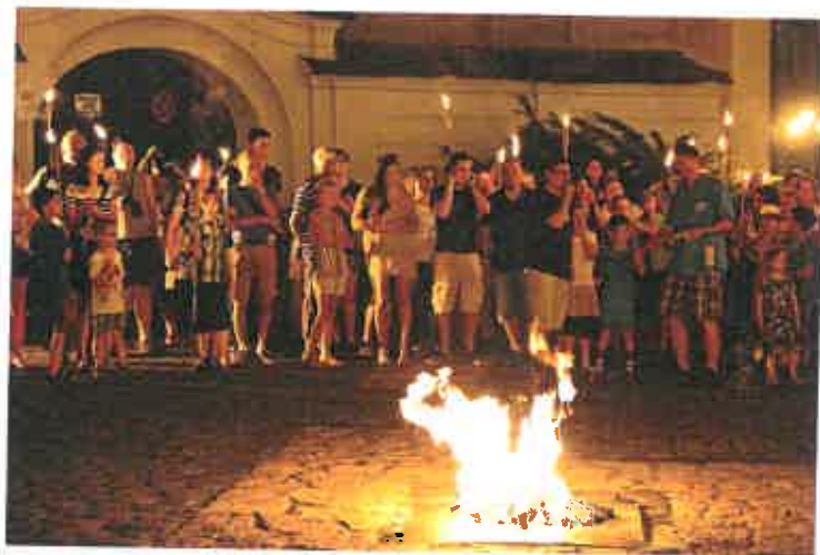
7. ábra: Tűzgrás