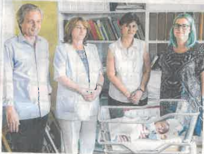
Az újszülöttek hasznos meglepetéseket kaptak

Ajándék a jövő múzeum-, galéria-, könyvtárlátogatóinak