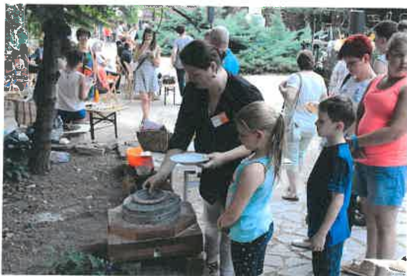
4. ábra: Élet a Bakonyi Ház játszótér