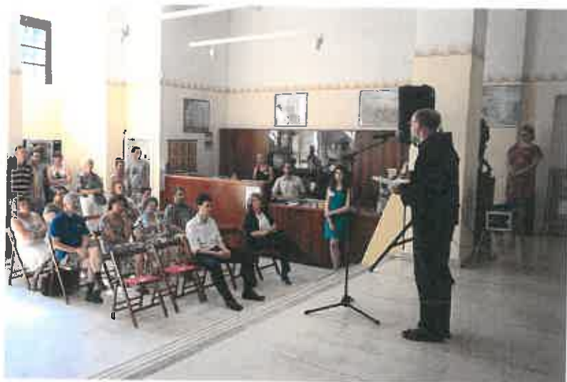
3. ábra: Kiállítás megnyitó