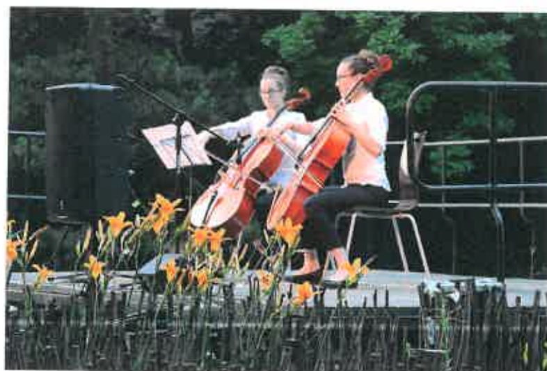
5. ábra: Füke-tanítványok