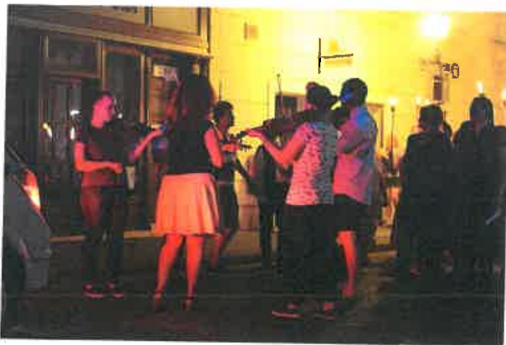
6. ábra: Fáklyás felvonulás